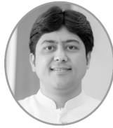
श्रीमान् धवलकुमारः संवादविषयः संस्कृत साहित्य में भक्ति