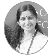
डॉ. जर्मिः सत्यन् दवे विषयः विवेकचूडामणिः