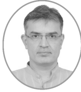
डॉ. दीपेशः कतिरा विषयः संस्कृत-पङ्क्तिर्याँ जो समग्र विश्वमें गूंजी