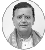
प्रा. सुकान्तकुमारः सेनापतिः विषयः संस्कृत साहित्य में जीवनमूल्य